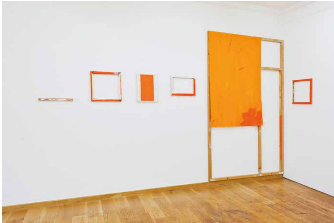
Charl van Ark, Für Blinky , olie op linnen, 2018/19