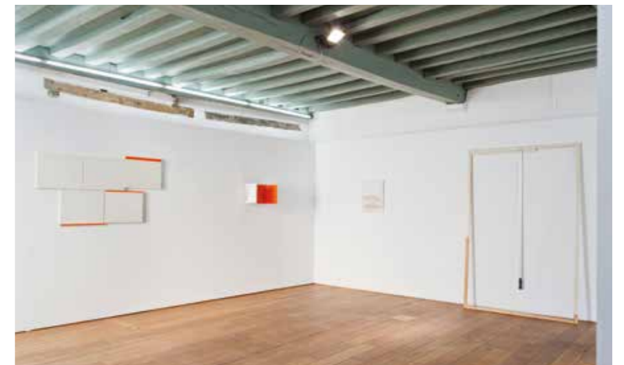
v.l.n.r.: Charl van Ark, Auf dem Weg zu dem Möven II , olie op linnen, 2018/19; Rheinfall , gemengde techniek, 2004; Ante Timmermans, Ohne Titel , acryl, canvas, collage, potlood op houten paneel, 2017/18; Charl van Ark, Doppelbett , gemengde techniek, 2012