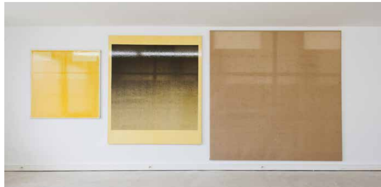
Charl van Ark, Lichtbeeld, fotobeeld, spiegelbeeld, (v.r.n.l.) licht op linnen, foto en vernis op linnen, vernis op linnen, 2019

De tentoonstelling is vrij te bezoeken op zaterdag en zondag en tijdens de schoolvakanties van vrijdag tot en met zondag, telkens van 14u tot 18u en op afspraak (via galerie@emergent.be ).